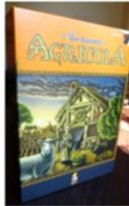
Même la couverture a été remastérisée.

N'espérez pas par contre une belle boîte de collection avec du matos d'exception et hors de prix, comme on a pu récemment le voir avec Les Aventuriers du Rail par exemple. Non, l'idée ici est plutôt d'upgrader la qualité du matériel et de dépoussiérer un peu les mécaniques de jeu, tout en restant abordable, et même moins cher que le jeu original à sa sortie. Certains fans ne manqueront sans doute pas d'être déçus, mais les néophytes apprécieront.