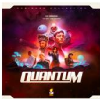
La boîte de Quantum (Fun Forge)

9 JUILLET 2015 MATINCIEL LAISSER UN COMMENTAIRE